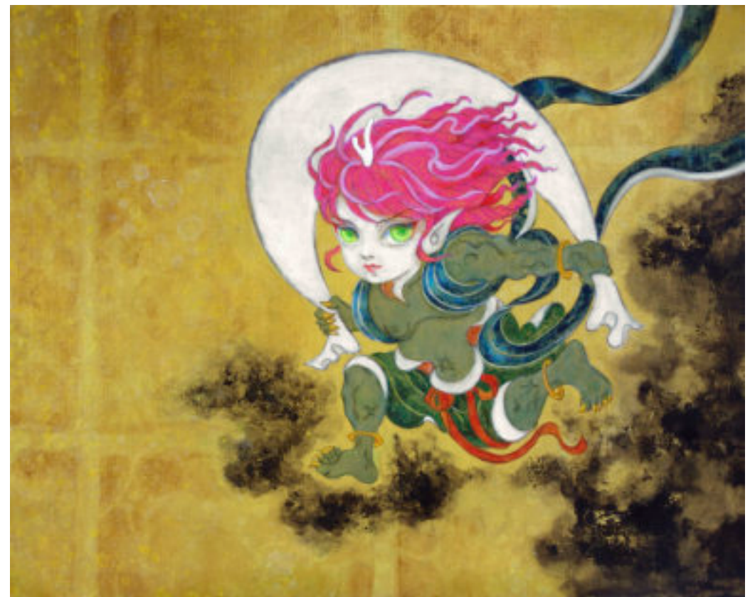
Homage to "Wind God and Thander God" by Tawaraya Soutatsu Ogata Korin and Sakai Hoitsu

Acrylic and phosphorescent paint on canvas