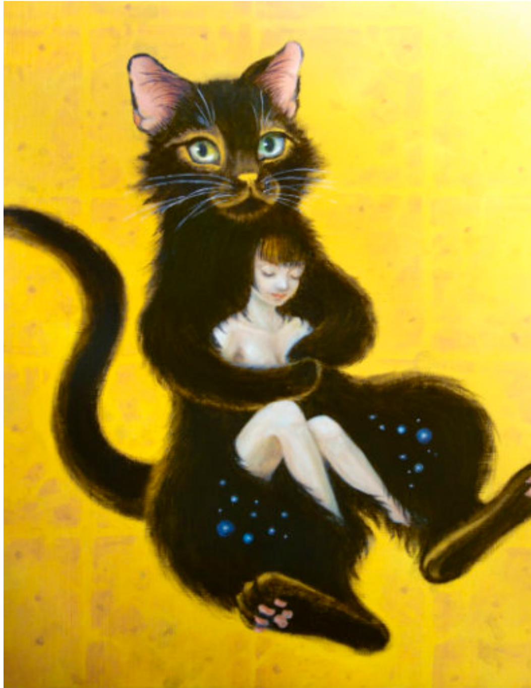
Beyond (彼方) Cat Fantasy 008