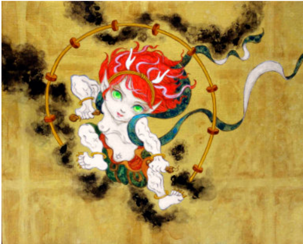
風神雷神（俵屋宗達・尾形光琳・酒井抱一）のオマージュ