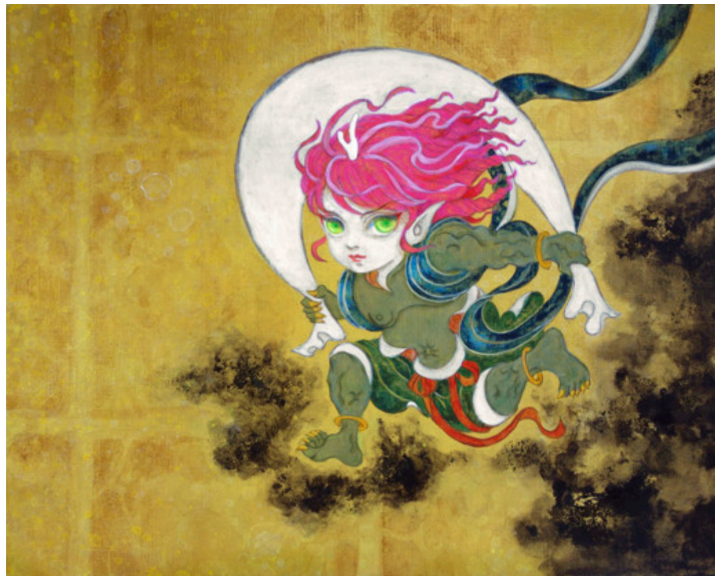
Homage to "Wind God and Thander God" by Tawaraya Soutatsu Ogata Korin and Sakai Hoitsu

Acrylic and phosphorescent paint on canvas