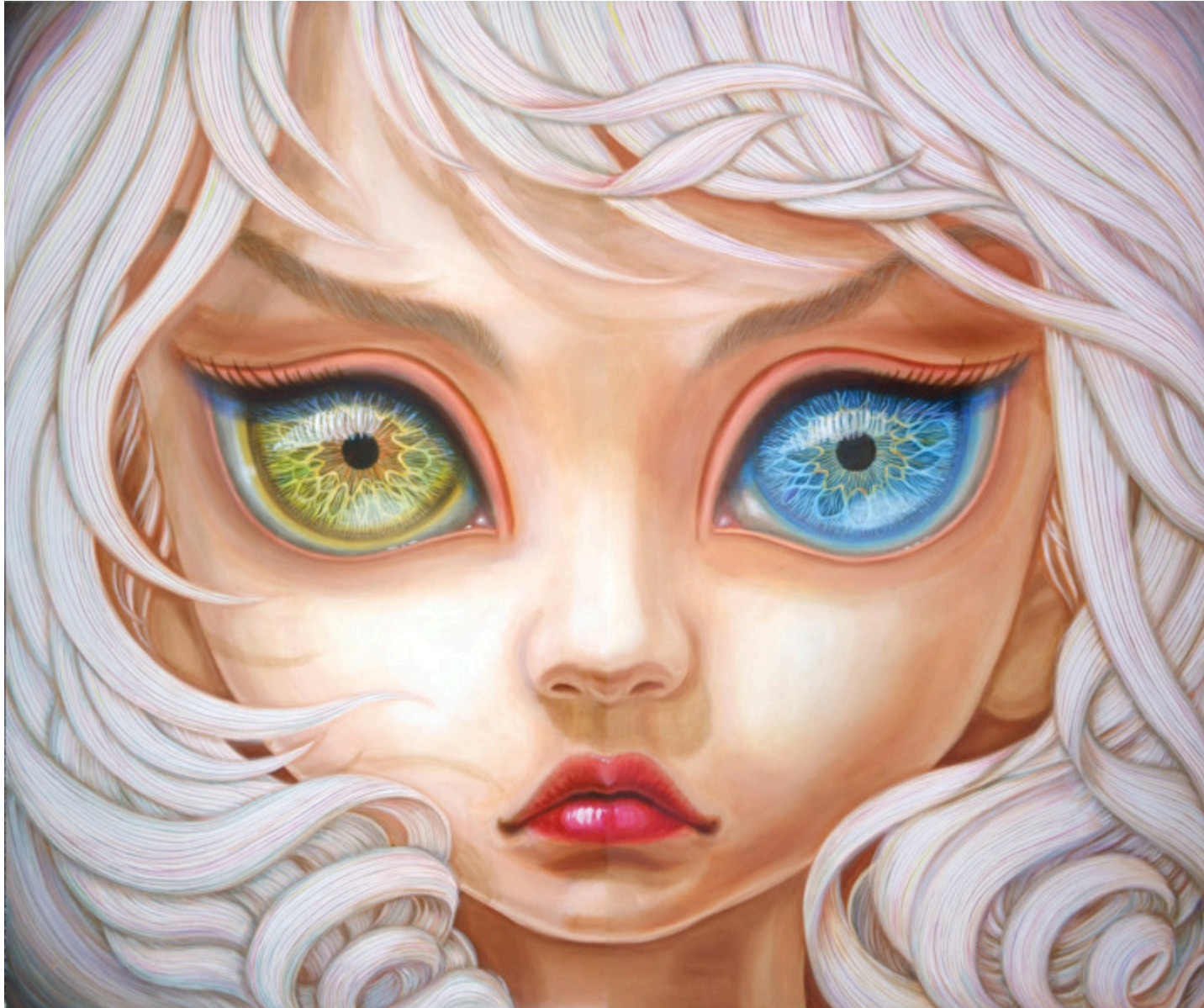
I See You