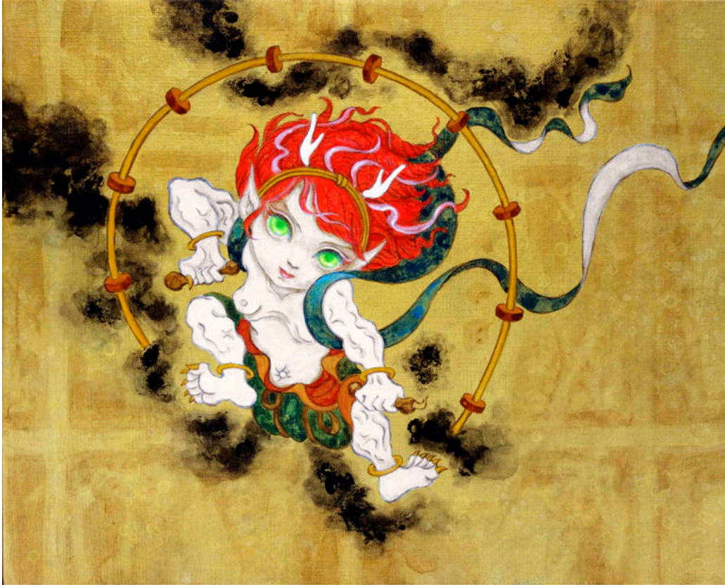
風神雷神（俵屋宗達・尾形光琳・酒井抱一）のオマージュ