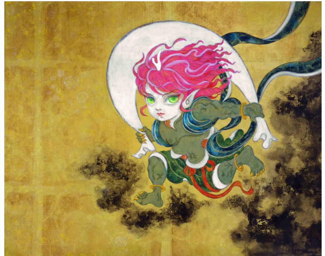
Homage to "Wind God and Thander God" by Tawaraya Soutatsu Ogata Korin and Sakai Hoitsu

Acrylic and phosphorescent paint on canvas 22.0x27.3cm 2022