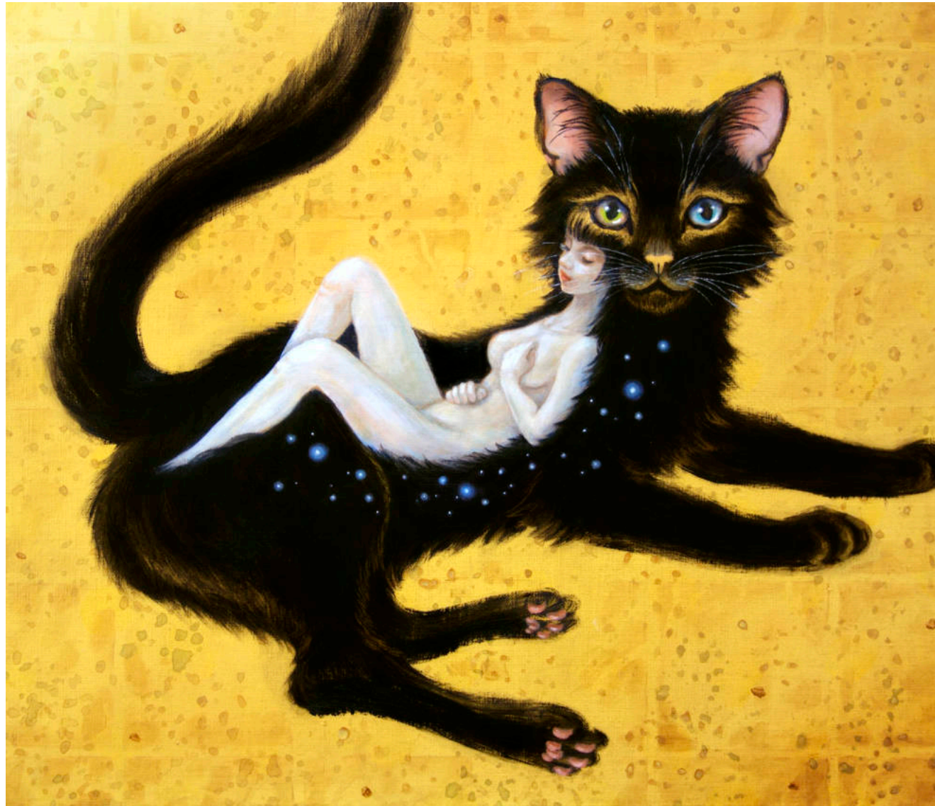
Cat Fantasy 009